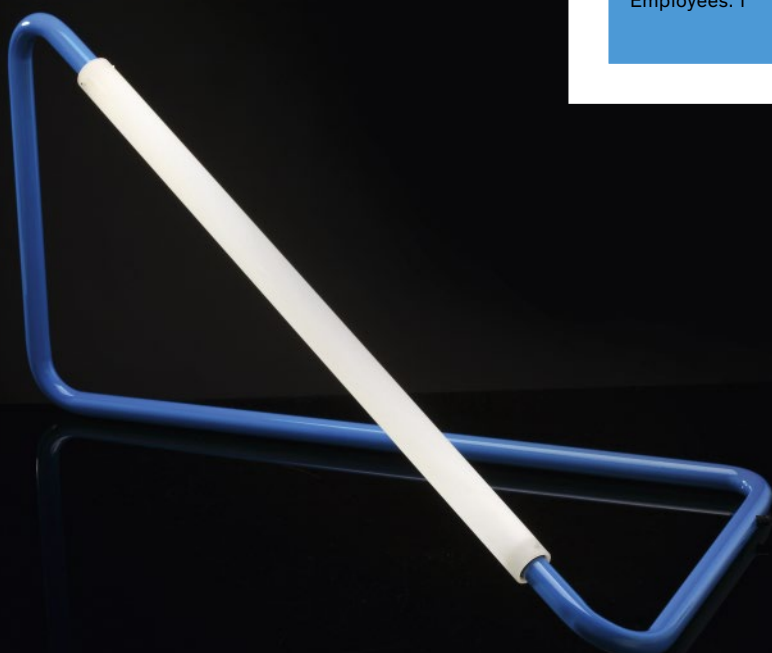
Light Object 001

Fields of work: lighting and object design Clients: architects, interior designers and shops